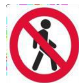
«Движение пешеходов запрещено»

Я в кругу с обводом красным, Значит ехать тут опасно. Тут, поймите запрещенье пешеходное движенье.