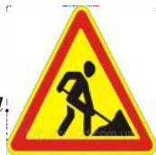
Знак «Дорожные работы»

Знак повесили с рассветом Чтобы каждый знал об этом. Здесь ремонт идёт дороги- Берегите свои ноги!