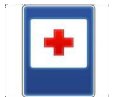
«Пункт медицинской помощи»

Если кто сломает ногу, Здесь врачи всегда помогут. Помощь первую окажут, Где лечиться дальше скажут