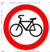
«Движение на велосипедах запрещено»

Велосипед на круге красном Значит, ехать здесь опасно!