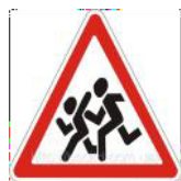
Знак «Осторожно дети!!!»

Я хочу спросить про знак, Нарисован он вот так: В треугольнике ребята Со всех ног бегут куда-то. Мой приятель говорит: «Это значит- путь открыт»