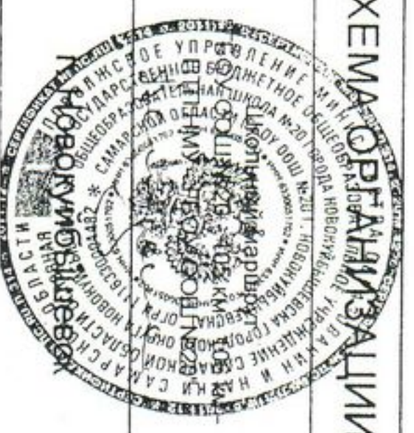
СХЕМА ОРГАНИЗАЦИИ ДОРОЖНОГО ДВИЖЕНИЯ

Лист 1 Листов 2 ООО "НПЦ" ИТС" Тел. 922-79-78, 372-60-23 Факс 372-60-24