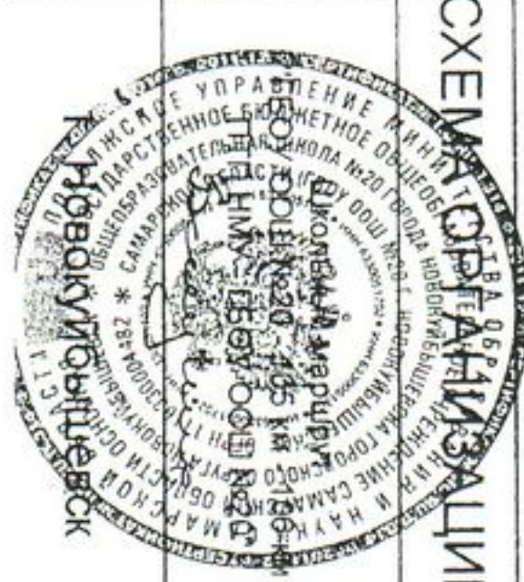
СХЕМА ОРГАНИЗАЦИИ ДОРОЖНОГО ДВИЖЕНИЯ

Лист 2 Листов 2 ООО "НПЦ "ИТС" Тел. 922-79-78, 372-60-23 Факс 372-30-24